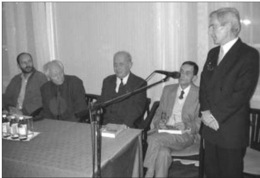
Bei der Präsentation des Bandes im Schriftstellerverband in Budapest