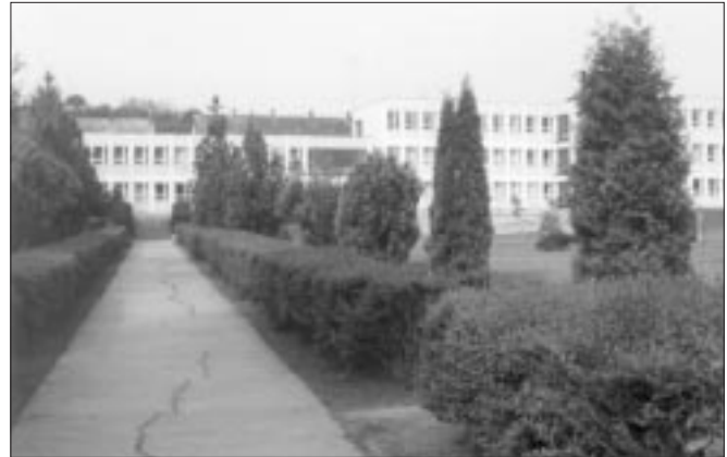
Die Grundschule in Jink

An der Schule sind zwei deutsche Fachzirkel tätig. Im traditionspflegenden Zirkel lernen die Kinder Lieder, Spiele und Tänze ihrer Großeltern kennen, die sie dann bei passender Gelegenheit auch vorführen. Im Deutschzirkel können sie ihre Sprachfähigkeit entwickeln. Seit Jahren wird im Sommer ein Volkskundelager veranstaltet. Begabte Kinder können im Sommer an einem Sprachlager in Österreich teil-