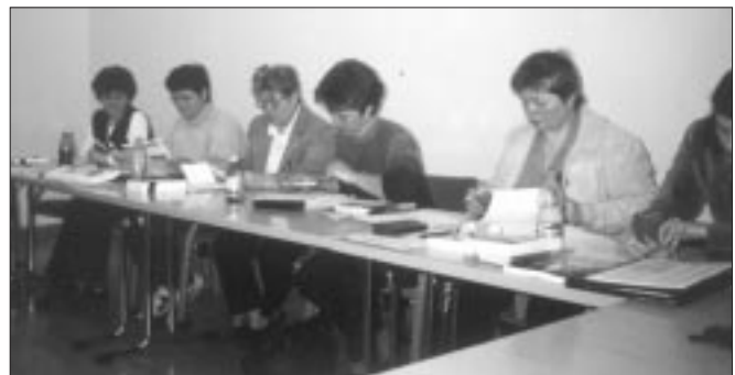
Der 2. Lehrgang der Kindergärtnerinnen hat mit dem Sprachkurs begonnen

Bezüglich der BUSCH-Akademie verlautete, daß der Bund auch weiterhin die Fortbildung bzw. den Erwerb des Zweitdiploms von ungarndeutschen Pädagogen unterstützt. So kann im September der bereits vierte Lehrgang (bisher 20 Bewerbungen) das Studium am Germanistischen Institut der ELTE Budapest aufnehmen. (Zwei Jahrgänge haben ihr Diplom bereits erhalten.) Auch die Zweitausbildung für Kindergärtnerinnen geht weiter. Den Bewerberinnen an die Hochschule im Schambek, die ab September mit dem Studium beginnen, wird als sprachliche Vorbereitung ebenfalls wie im vorigen Jahr ein kostenloser Sprachkurs von 130 Stunden angeboten, von denen rund 20 Kindergärtnerinnen Gebrauch machen.