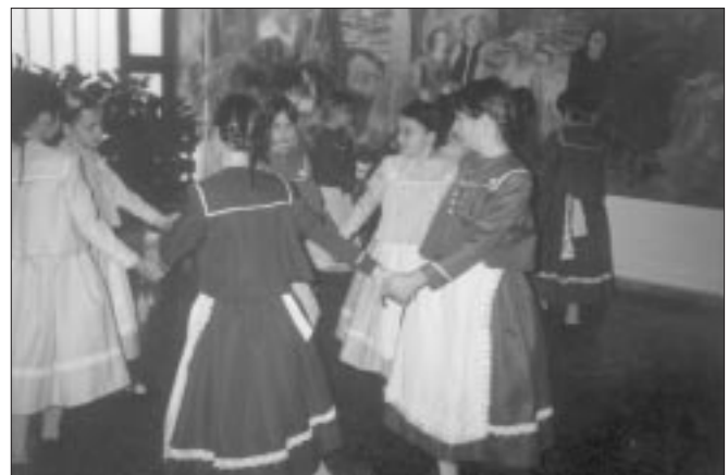
Auftritt des Traditionspflegenden Deutschzirkels

nehmen. Seit drei Jahren fungiert die Schule auch als Musikschule. Von Jahr zu Jahr wächst die Zahl der am Musikunterricht teilnehmenden Schüler. Vor zwei Jahren wurde eine Blaskapelle gegründet, auf die sowohl die Lehrer als auch die Schüler sehr stolz sind und die mit großem Erfolg bei Veranstaltungen im Ort mitwirkt. Zwei Mitglieder dieser Kapelle können im Sommer an ei-