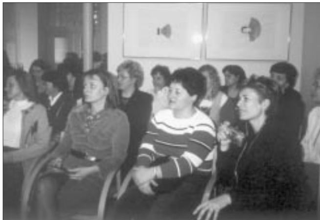
Teilnehmer des 2. Lehrgangs der BUSCH-Akademie bei der Übergabe der Diplome

Ich habe mich bisher zurückgehalten, über ein Thema zu schreiben, daß mich seit Jahren sehr beschäftigt, aber nachdem neulich in einem deutschen Wochenblatt öffentlich darüber Beschwerde geführt wurde, darf ich endlich auch meine Enttäuschung niederschreiben über fehlende Deutschkenntnisse, vor allem dort, wo man sie keineswegs erwarten dürfte. Wie immer hoffe ich dabei, daß meine Beiträge in der BUSCH-Trommel auch gelesen werden und dies in diesem Falle insbesondere von jenen Mandataren und Würdenträgern, die Entscheidungen in Gremien richtunggebend beeinflussen können. Es geht doch nicht an, und ich kann dies bei allem Verständnis für schwierige Verhältnisse beim besten Willen nicht kritiklos hinnehmen, daß in Amtsstuben von Gemeinden und Städten, die sich dem Zeitgeist entsprechend ihrer ungarndeutschen Wurzeln rühmen, kein einziger Dienstnehmer zu finden ist, der die deutsche Sprache we-