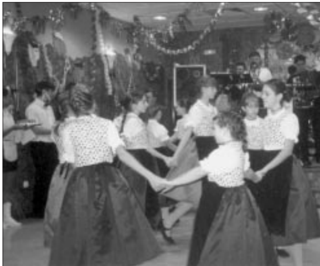
Die Erstkläßler beim fröhlichen Spielen und Tanzen

Es fragen aber viele, wozu man in der modernen Informationsgesellschaft den Volkstanz noch braucht. Virtuelle Erlebniswelten werden auf Knopfdruck von modernsten Techniken angeboten. In welchem Dilemma steckt dann eigentlich der Deutschlehrer im Nationalitätenunterricht, wenn er auch Minderheitenkunde weitergeben beziehungsweise gestalten möchte? Es steht ja fest, daß Kinder und Jugendliche am liebsten Pop, Rock und Rave/Techno hören und sich zu dieser Musik frei bewegen.